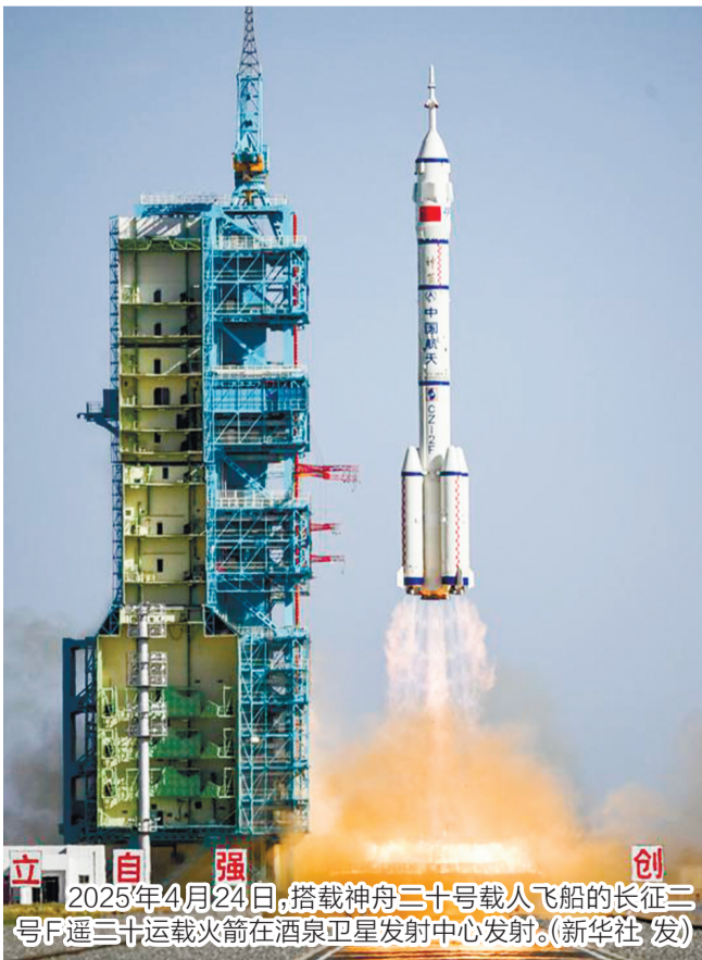
2025年4月24日,搭载神舟二十号载人飞船的长征三号F遥三十运载火箭在酒泉卫星发射中心发射。

空间碎片的运动速度可达每秒7至10公里,动能巨大且破坏力极强。毫米级碎片会划伤航天器舷窗和太阳翼,影响设备功能;厘米级碎片可穿透航天器外壳,击穿燃料箱等关键部件,引发泄漏或爆炸;超细碎片则可能穿透航天服,直接威胁航天员的生命安全。当碎片密度达到临界值,还可能形成“碎片云”,阻断人类进入太空或使用卫星的通道,对太空活动造成长期灾难性影响。