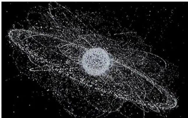
空间碎片一直呈快速增长的趋势

空间碎片由人类航天活动直接产生或间接衍生。空间碎片主要分为三类:一是废弃航天器及部件,包括退役卫星、火箭残骸等,是最主要来源,占比超40%;二是航天操作废弃物,如分离螺栓、保护罩、遗落工具,以及航天器表面脱落的涂层碎片、发动机残渣等,尺寸小但数量庞大;三是碰撞与爆炸产生的次生碎片,这类碎片会引发“碎片雪崩”,导致轨道碎片密度指数级增长,是空间碎片数量激增的关键原因。