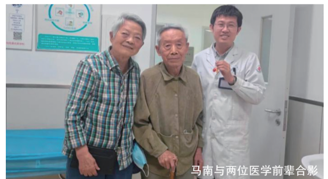
马南与两位医学前辈合影