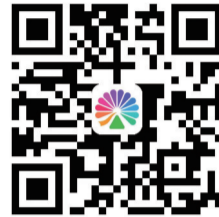
大麦网 购票二维码

目前,大麦网各档球票正在热销中。组委会提醒广大球迷,务必通过官方渠道购票,并合理安排行程。随着比赛日临近,剩余票源有限,欲购从速。欢迎全省球迷齐聚滨州,共同点燃绿茵激情。