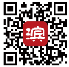
品质滨州客户端 购票二维码