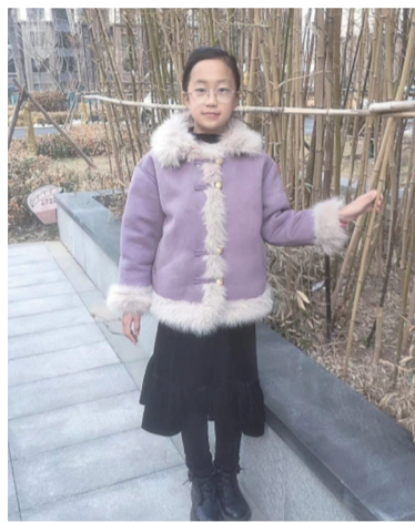
对美好未来的期盼与向往,我喜欢过年! (指导教师:毛筱筠)

满载而归的我们,心里充满了喜悦,正如王安石的诗中所述“爆竹声中一岁除,春风送暖入屠苏。千门万户曈曈日,总把新桃换旧符”。春节不仅是阖家团圆的温馨时刻,更是崭新生活的起点,承载着人们