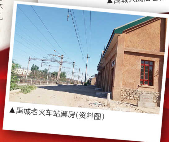
▲禹城老火车站票房(资料图)