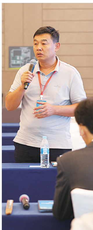
圆桌座谈与自由交流

本次交流会吸引了包括韩国跨境电商贸易协会、韩国最大快递公司韵达速递株式会社、韩国头部电商平台 Coup - ang 在内的近30家韩国知名企业代表。滨州市160家企业积极参与,重点考察了6家企业,达成多项合作意向,并为40余家企业开拓了新的合作渠道,有力助推滨州企业扬帆出海。“借助这个高效平台,我们