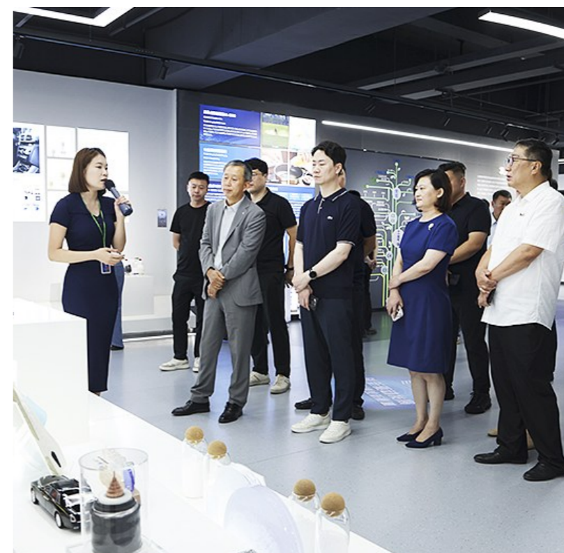
与会嘉宾考察山东京博控股集团有限公司

今年以来,全市紧紧围绕“113388”工作体系和“品质滨州”奋斗目标,全力推动“5210N”产业集群向高端化、智能化、集群化发展。市投资促进中心深挖产业潜力,以“招商引资就是招产业生态”为核心理念,聚焦“延链、补链、强链”精准发力,助力更多企业实现从“滨州制造”到“滨州好品”的价值跃升。锚定产业集群高质量发展核心目标,市投资促进中心将以此次“滨州好