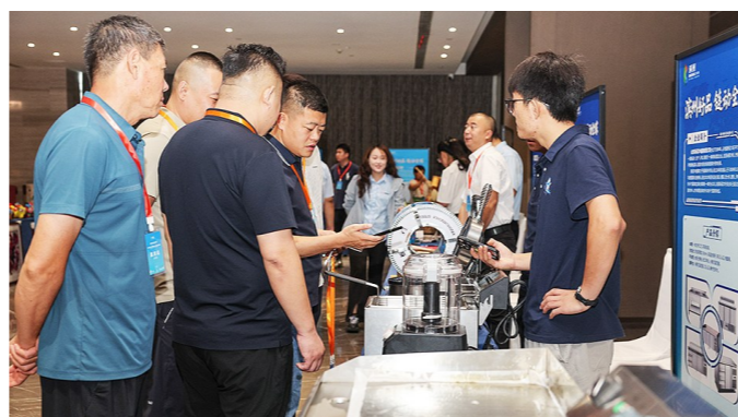
与会嘉宾在“滨州好物”展示与对接现场

针对企业出海需要的平台、渠道等问题,滨州市投资促进中心充分发挥招商引资信息资源优势,精准施策。活动特别邀请了韩国知名跨境电商平台负责人、海外仓运营商、国际物流服务商代表以及国际贸易、跨境电商领域的专家学者,围绕韩国电商平台的实操运营进行专业解读,并针对滨州企业在进军韩国市场过程中遇到