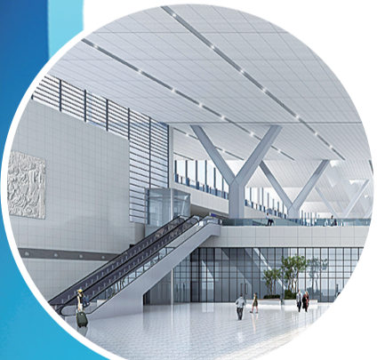
改造后的滨州高铁站内部效果图