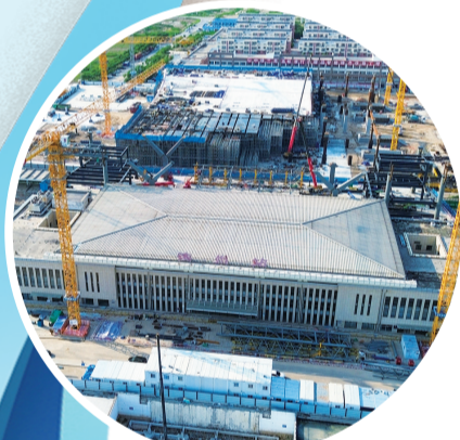
滨州高铁站改扩建建设现场