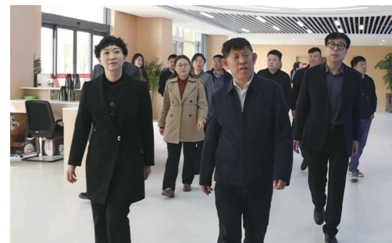
市政协赴惠民围绕农业、旅游产业发展开展“联心汇智 履职为民”委员联络活动