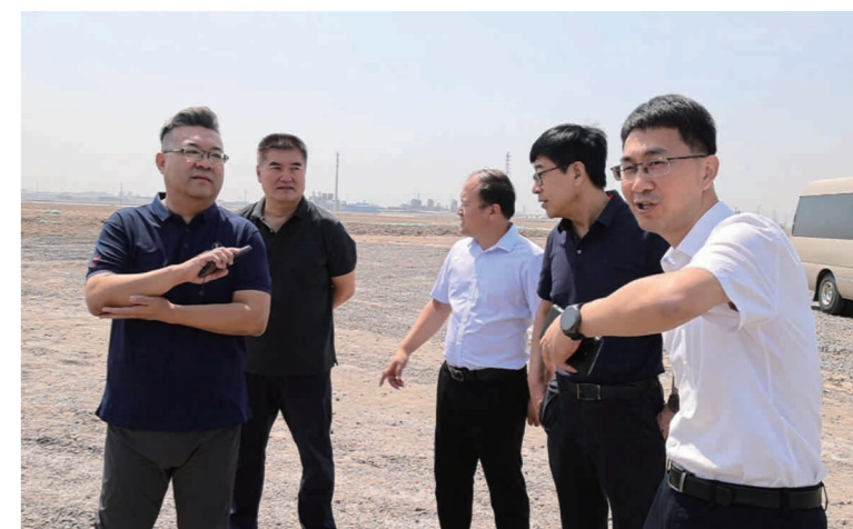
市政协赴北海经济开发区开展“联心汇智 履职为民”委员联络活动