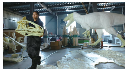
制作车间内,忙碌的工人