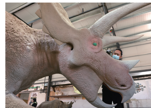
即将走出车间的三角龙