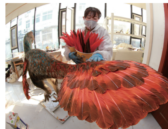
工人为窃蛋龙插制出美丽羽毛