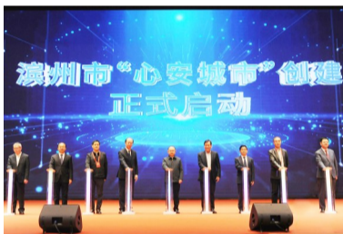
2024年,滨州打造了全国首个“心安城市”,发布全国首个“心安城市”建设标准。图摄于滨州市“心安城市”创建启动仪式。

续擦亮“全国法治政府建设示范市”金字招牌。 心安,则民安、家安、万事安、天下安。滨州将持续践行“心安是更高层次的平安”理念,着力打造安全稳定的社会环境、积极向好的就业环境、绿色宜居的生活环境、优质高效的康环境,让每个人在滨州都能心安顺遂、人生出彩、梦想成真,奋力谱写中国式现代化最美滨州“心安”篇章。