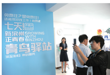
滨州接续推出“5.0版”人才新政,设立2亿元人才建设资金,有10项补助性政策含金量全省领先。图摄于滨州青鸟驿站。