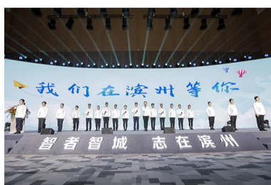
近年来,滨州深入实施人才强市战略,自2020年以来,已经连续举办五届“滨州人才节”。图摄于“滨州人才节”。

政,设立2亿元人才建设资金,有10项补助性政策含金量全省领先。五年来,共兑现各类人才政策资金6.2亿元。累计有800多名科技领军人才、7万多名本科及以上学历大学生,把心放在滨州、把家安在滨州、把事业留在滨州,让滨州实现了“人才净流入”和“人口结构性增长”的转变。