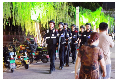
近年来,滨州树牢“平安是基、心安是魂”理念,蹚出了市域治理现代化的“滨州路径”,持续擦亮“全国法治政府建设示范市”金字招牌。图摄于滨州中海调街。