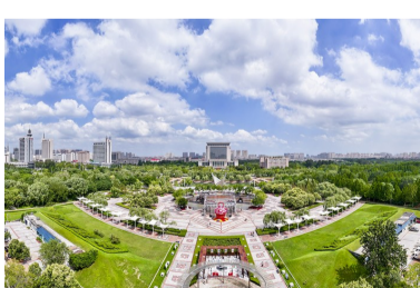
2024年,滨州发展成绩令人振奋,多项指标全省领先,交出了近20年最亮丽答卷。图为滨州鸟瞰图。

全面深化改革为动力,围绕“113388”工作体系,聚焦品质滨州奋斗目标,坚持发展要、实干当先、勇争一流,打好招商引资、项目建设、工业经济“三大战役”,实施提升市场主体活力、干部内生动力、风险防范能力“三大行动”,落实八个加力提效,全力提升八大品质,高质量完成“十四五”规划目标任务,奋力谱写中国式现代化最美滨州篇章。