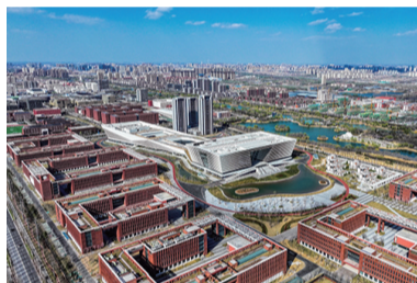
2024年,滨州全社会研发投入占GDP比重达到3.7%,实现全省“四连冠”。图为滨州鸟瞰图。

连冠”。新增省级创新型中小企业436家,新增省级“专精特新”中小企业257家,科技型中小企业评价入库1789家。 滨州科创赋能加力提效,加速构建“五院十校N基地”科创格局,滨州科技大市场全省率先投用,渤海先研院科创带动效应超80亿元,在创新引领的“精明增长之路”上,闯出了新天地、干出了新精彩。