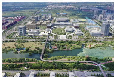
加速构建“五院十校N基地”科创格局,滨州科技大市场全省率先投用。图为滨州鸟瞰图。