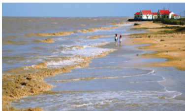
“海韵河秀”勾勒出“城水相依、舒朗大气”的城市形态。图为181公里海岸线。

滨州,既是沿黄城市,又是沿海城市,“海韵河秀”勾勒出“城水相依、舒朗大气”的城市形态,处处渲染着美的意境。