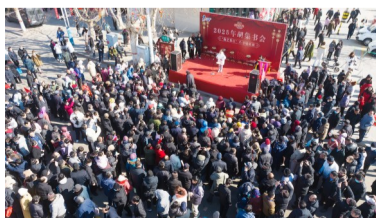
滨州历史悠久、人杰地灵,孙子文化、黄河文化、红色文化在这里交融。图摄于2025年胡集书会。

传承千年的阳信鼓子秧歌,八百年不散的惠民胡集书会,三百年声韵的沾化渔鼓戏,百余年吟唱的博兴吕剧。滨州有国家级非遗项目10个、省级非遗项目66个,董永和七仙女、双龙跪臣等民间故事,代代传颂;蓝印花布印染、莲花灯制作、葫芦书法微烙等民间技艺,惊艳超群;滨州剪纸、木版年画、草柳编、布老虎、泥塑等民间手艺,尽显匠心。