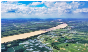
滨州,一座因立渤海之滨、黄河之州而得名的城市。图为黄河穿城鸟瞰图。

滨、黄河之州而得名的城市,一座依河而建、向海而生的城市。黄河流域生态保护和高质量发展、京津冀协同发展、环渤海经济圈等战略叠加,滨州已经成为融入京津冀、联通环渤海、面向东北亚的桥头堡。