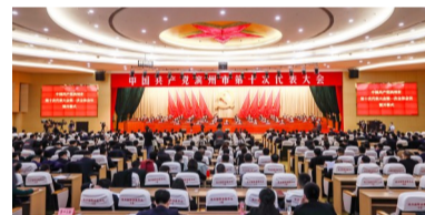
近年来,滨州扛牢使命、争先向前,干出了“八大品质”的全面提升。图摄于中国共产党滨州市第十次代表大会。

2023年,滨州在全省首发、全国率先成体系构建起“1+8”品质城市评价指标体系系列标准。