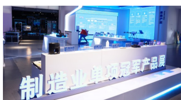
2024年滨州有67项全球、全国冠军产品,其中16项产品产能、产量、营收或市场占有率列全球第1位。图摄于滨州渤海先进技术研究院。

滨州,是一座家底厚重的实业之城。近年来,滨州坚持“工业立市、制造强市”,培育了高端铝业、精细化工、智能纺织、食品加工、畜牧水产五大千亿级优势产业集群,其中高端铝业、智能纺织产能全球第一,食品加工营收全国第一,去年五大集群总营收达到1.2万亿,全市工业营收达到1.4万亿。