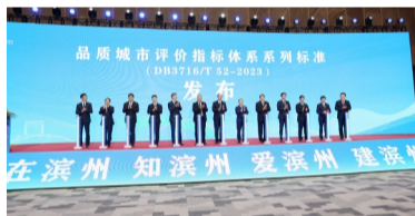
滨州在全省首发、全国率先成体系构建起“1+8”品质城市评价指标体系系列标准。图摄于“标准赋能品质滨州 创新未来”品质城市标准化建设成果发布会。

近年来,全市上下扛牢使命、争先向前,干出了“八大品质”的全面提升。发展品质越来越高,五大千亿级产业集群优势重塑,新能源产业集群加速崛起,经济大盘实现稳中向好、稳中有进;科创品质越来越强,科技创新已成为滨州跨越发展的最强引擎、最强跳板;开放品质越来越活,通