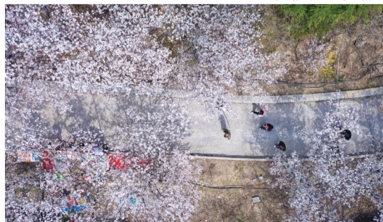
游人在樱花道中穿行而过。