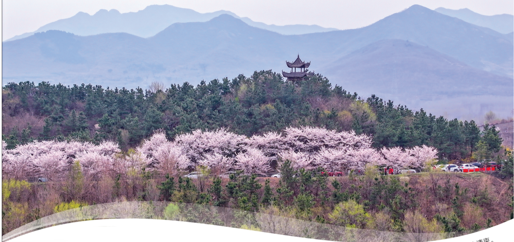
十里樱云漫卷,每一缕风都裹着春天的清爽。