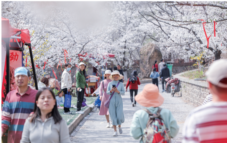
樱花绽放,春色撩人,市民共赴一场樱花之约。