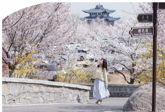
樱瓣纷扬如雪落,撞碎了满山春色。