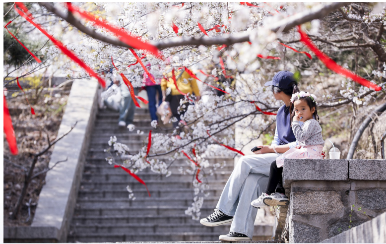
在树下赏春光,花瓣的缝隙间时光流淌成河。