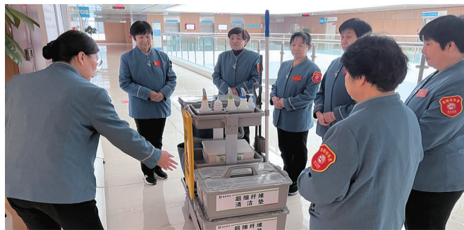
保洁团队接受标准化作业流程培训。