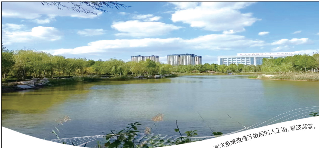
蓄水系统改造升级后的人工湖,碧波荡漾。