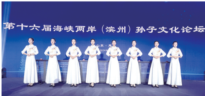
2024年9月12日,“永升”客服团队亮相“第十六届海峡两岸(滨州)孙子文化论坛”。