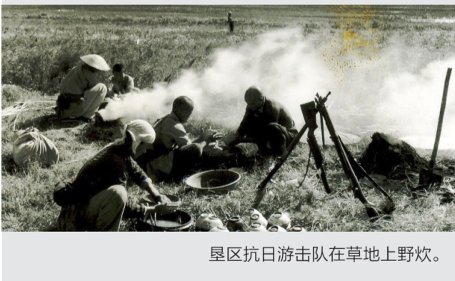
垦区抗日游击队在草地上野炊。

月初，第五军收复邹平城，成立了抗日民主政府。这是山东抗战开始之后，在起义部队从日伪手中夺回县城的情况下，民主选举的第一个抗日县级政权。