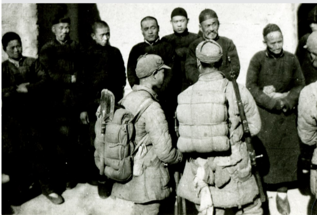
1942年冬，清河区八路军插入滨县蒲台敌占区，向敌占区群众宣传我党政策。