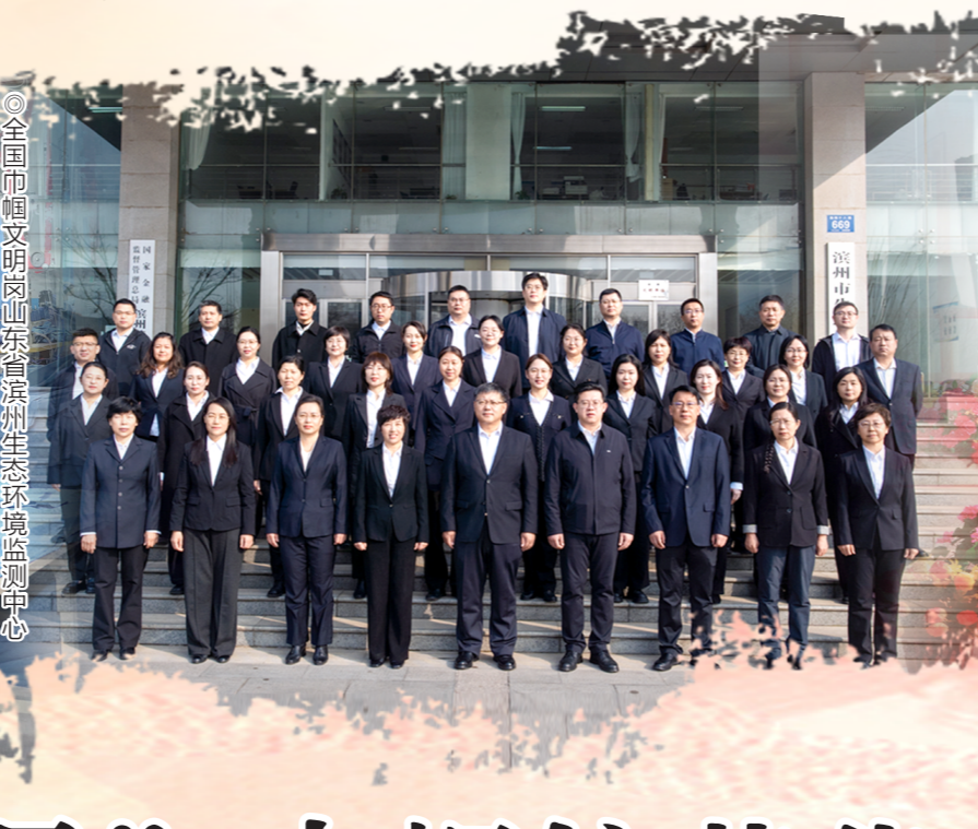
全国巾帼文明岗山东省滨州生态环境监测中心