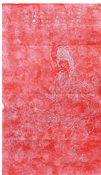
●拓片 送子观音 65×37cm