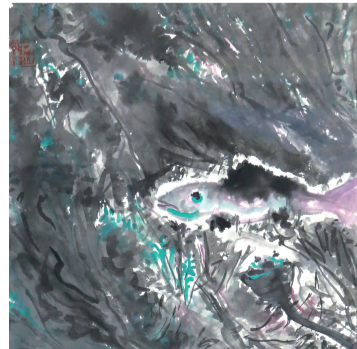
●董海涛 鱼的日常 33×33cm