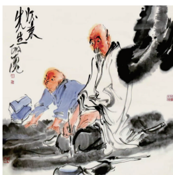
●秦嗣德 怀素先生 68×68cm