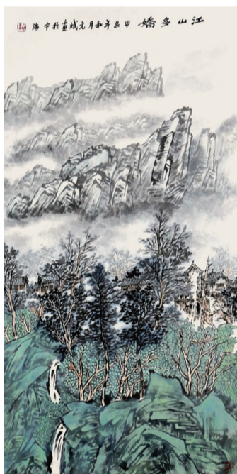
●张元斌 江山多娇 136×68cm