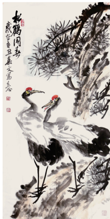
●徐春文 松鹤同春 138×68cm