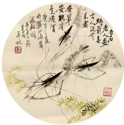
●赵紫林 大虾 42×42cm