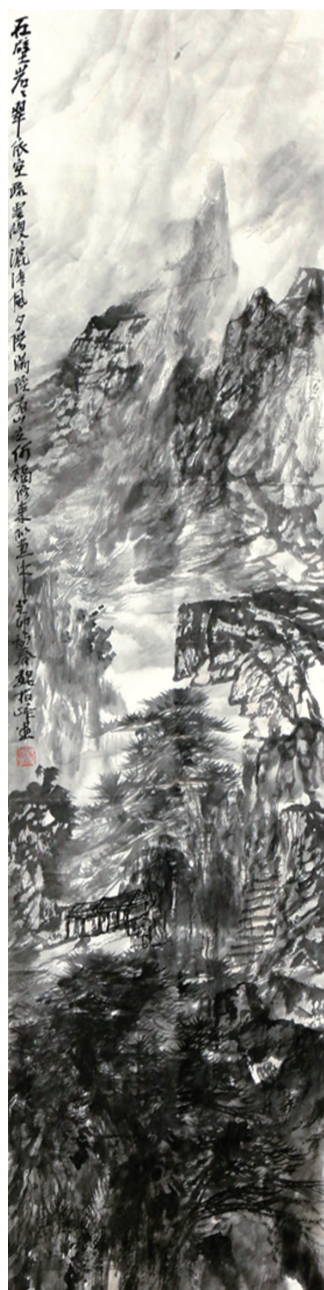
●魏梅峰 山水 136×34cm