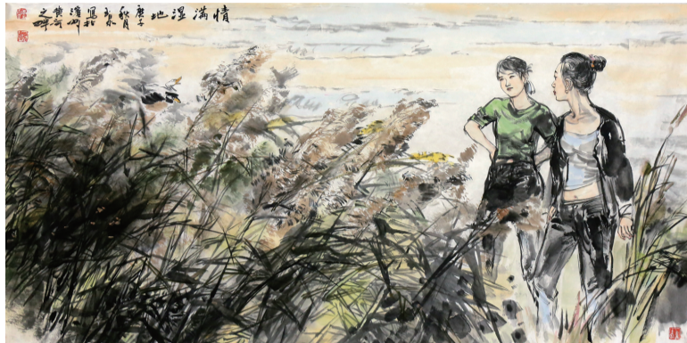
●李玉泉 情满湿地 136×68cm