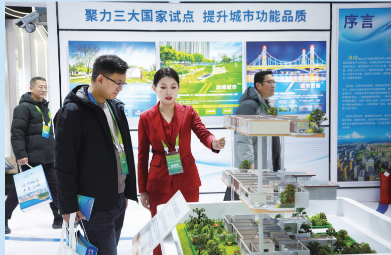
本届城博会涉及领域多,参展企业多,展示产品全