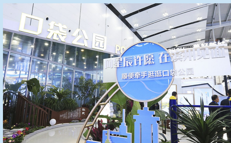
选取口袋公园等13个全省代表性城市建设成果,采用三维立体地图和场馆实景方式展示