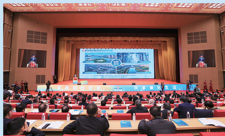
第四届山东省城市建设博览会在滨州国际博览中心(黄河三角洲交易中心)盛大开幕