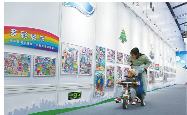
“一米看城市·童心向未来”儿童绘画作品展