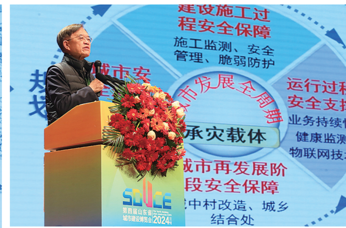
中国工程院院士、清华大学公共安全研究院院长范维澄作主题演讲