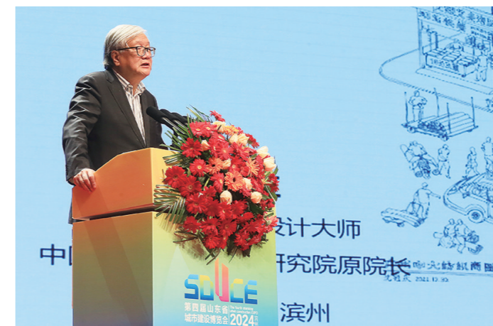
全国工程勘察设计大师、中国城市规划设计研究院原院长李晓江作主题演讲