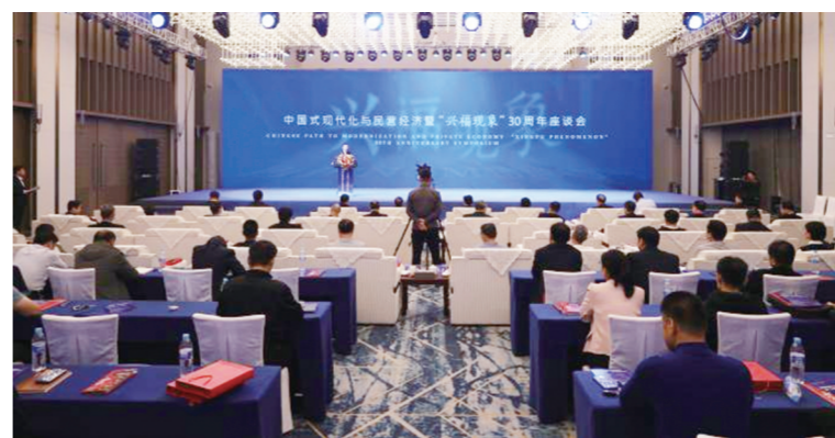
2024年10月26日,中国式现代化与民营经济暨“兴福现象”30周年座谈会在博兴召开。