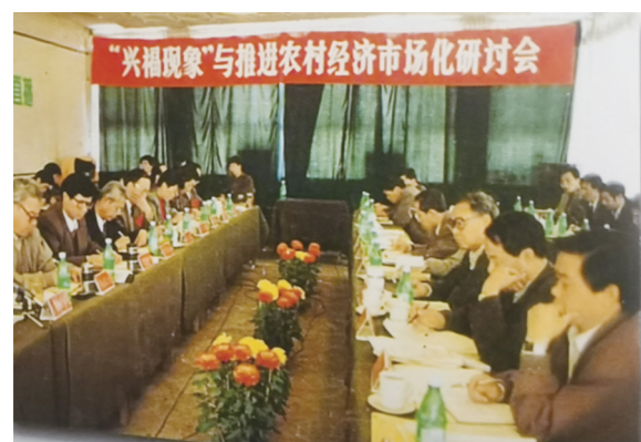
1994年11月9日,中共滨州地委、滨州地区行署在博兴召开“兴福现象”与推进农村经济市场化研讨会。