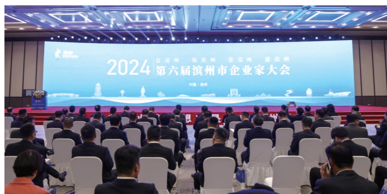
2024年10月12日,第六届滨州市企业家大会举行。