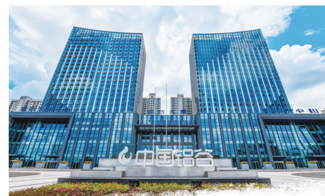
滨州加快构建现代化铝产业体系,唱响“中国铝谷”品牌。