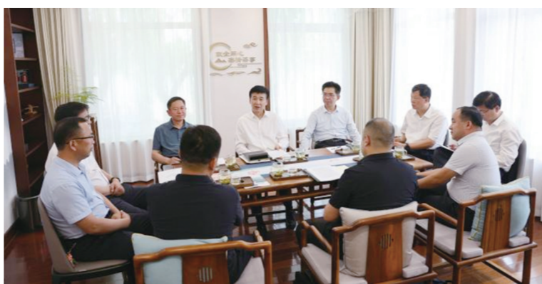
2024年5月23日下午,滨州市第四十七期“政企同心·亲清茶事”对接交流活动举行。