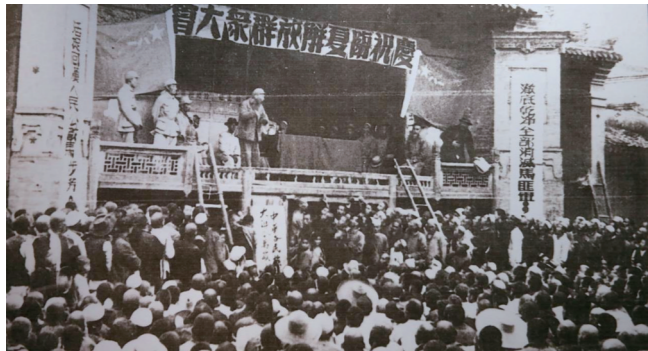
●渤海子弟兵在西北战场经历十大战役,一路解放了16座城市。图为临夏解放时的盛况。