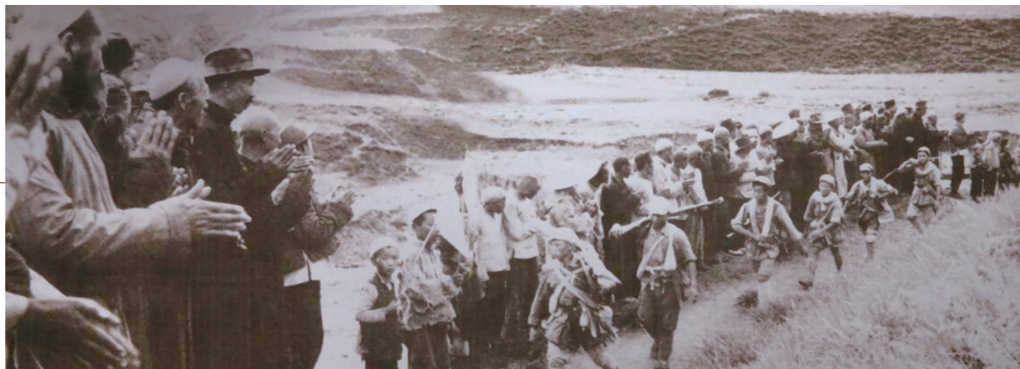
●解放军进入青海,受到各族人民的热烈欢迎。