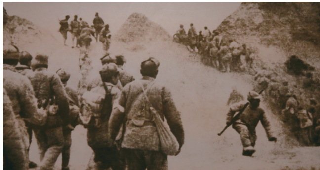
●我军通过突破口攻入永丰镇。