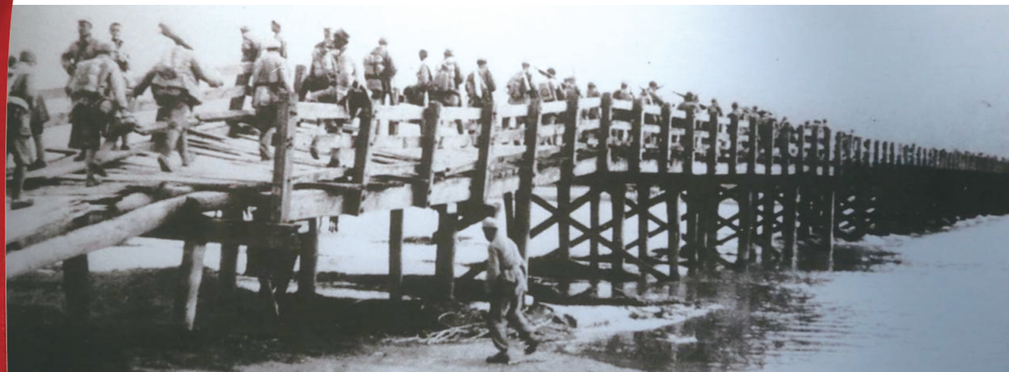
●我军强渡泾河,向西府地区挺进。