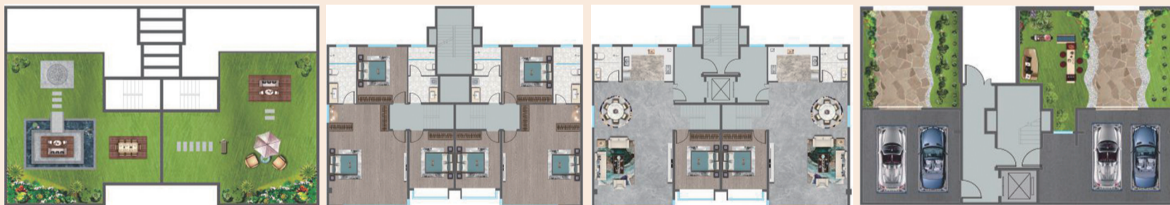
上叠 四室两厅三卫 220平方米