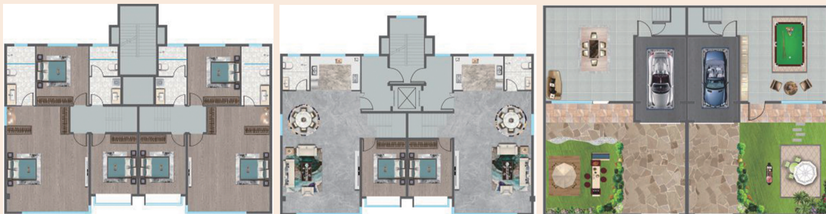
下叠 四室两厅三卫 220平方米