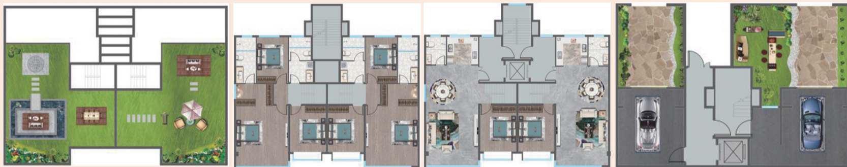
上叠 四室两厅三卫 195平方米

院,户户配有私家车库 【附属物价值】地上一层,3米层高,附房价格主房使用价值 【物业】自持物业 (注:1亩=666.67平方米)