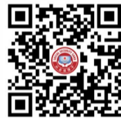
景区购票优惠活动商户名单(扫码查看)

温馨提示: 请提前激活社保卡金融账户,该业务需到社保卡发卡行(见卡面左上角)银行网点办理。为保证支付成功,请确保社保卡金融账户余额充足,避免因余额不足导致交易失败。