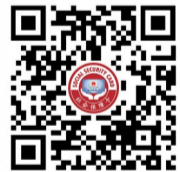
滨州市“1分钱乘公交”活动公交线路名单(扫码查看)

温馨提示: 请提前激活社保卡金融账户,该业务需到社保卡发卡行(见卡面左上角)银行网点办理。为保证支付成功,请确保社保卡金融账户余额充足,避免因余额不足导致交易失败。