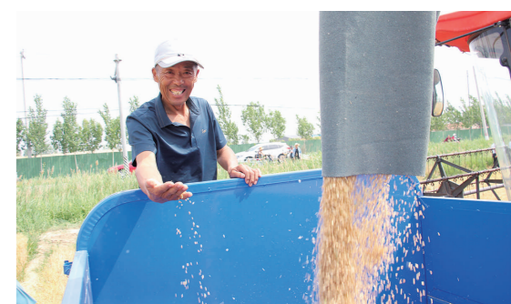
喜上眉梢