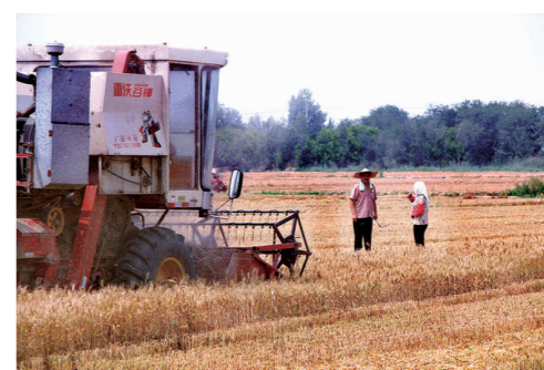
丰收的喜悦