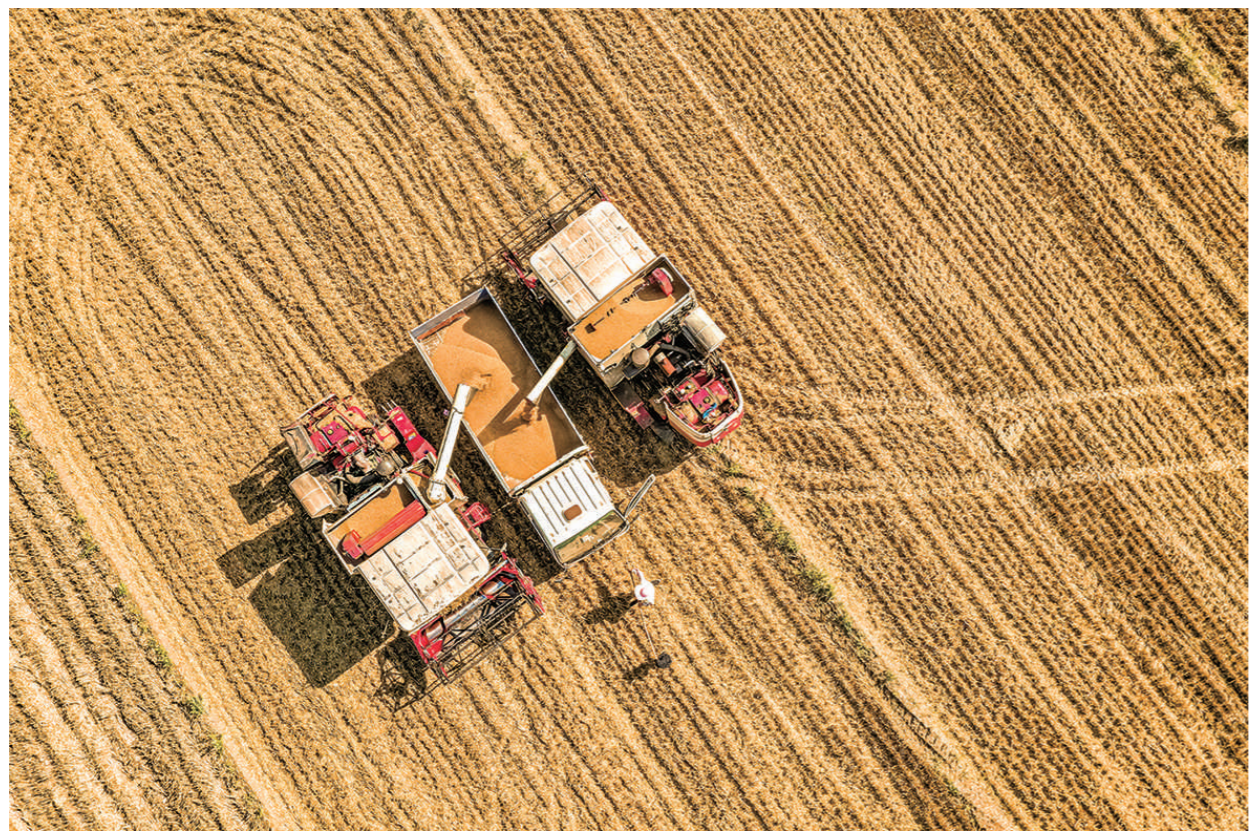
颗粒归仓