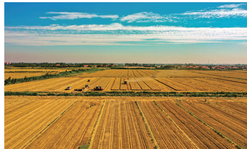
《麦收时节》李洪武 摄影