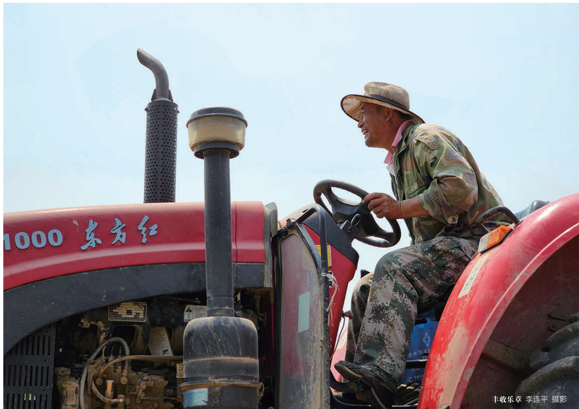
丰收乐章