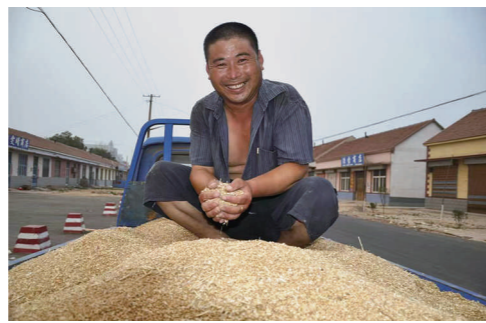
丰收的喜悦