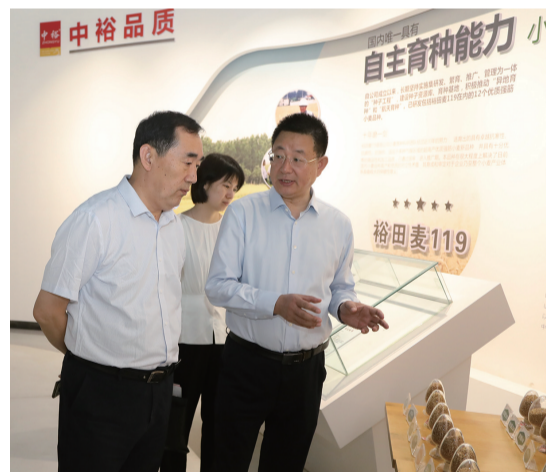
调研组一行到滨州中裕食品有限公司调研