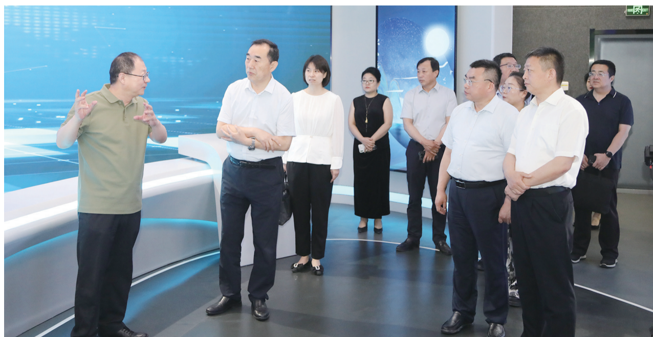
调研组一行到滨州市新闻传媒中心(集团)调研