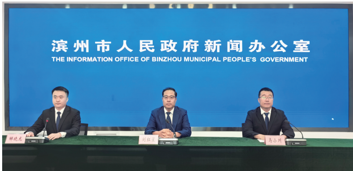
□晚报记者 李忠辉 实习生 张书豪

4月28日,2024年滨州市初中学业水平考试及高中阶段学校招生工作新闻发布会举行,会上详细公布了考试科目、时间、分值等重要信息。