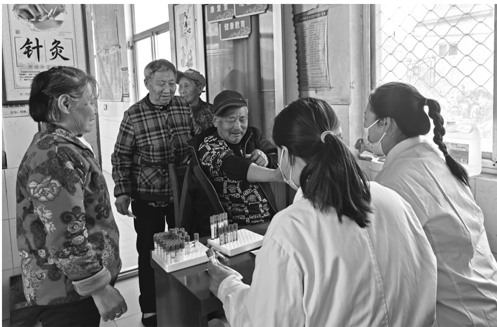
□晚报记者 张迎宾 通讯员 张青青

晚报讯 近日,秦皇台卫生院体检团队去往老年人查体地点秦皇台乡三石营卫生室。这一天,家住东石营村的赵大爷老两口也早早起了床,按照前几天卫生室医生的嘱咐,他们没有吃饭没有喝水,拎起马扎拿上身份证,急忙赶往村卫生室院内,登记领号排队,参加今年的老年人免费健康体检。